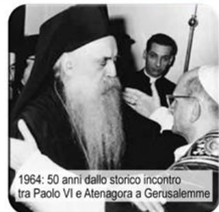
1964: 50 anni dallo storico incontro tra Paolo VI e Atenagora a Gerusalemme

2010-2020 MISSION POSSIBLE!? L'IRC e la sfida-emergenza educativa