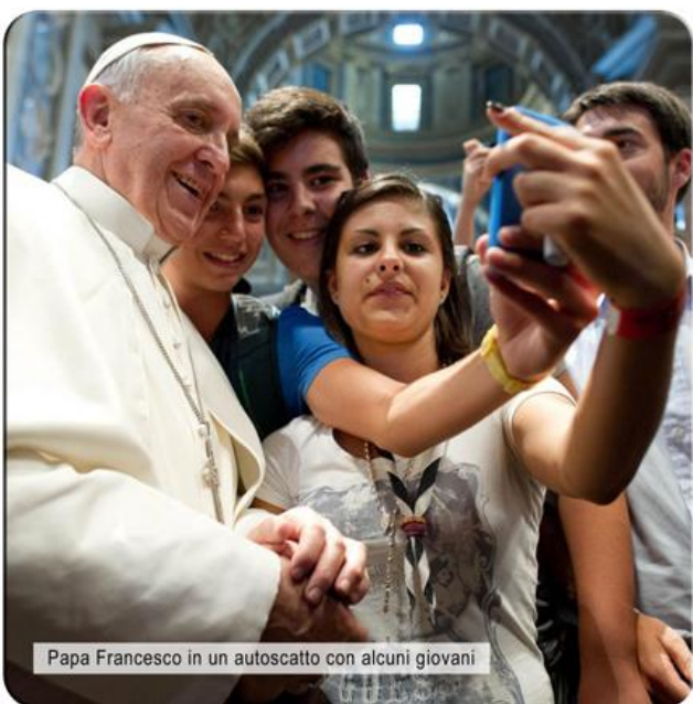
Papa Francesco in un autoscatto con alcuni giovani